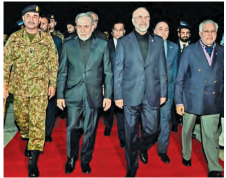
చర్యలకోసం పాక్ వచ్చిన ఇరాన్ ప్రతినిధుల బృందం

ఇస్లామాబాద్ లో 'అమెరికా, ఇరాన్ మధ్య తొలిరోజు నాలుగు గంటలు చర్చలు పాక్ ప్రధాని షేహబాజ్ షరీఫ్ మధ్యవర్తిత్వం స్తంభించిన ఆస్తులు, నిధులు విడుదల చేయాలని ఇరాన్ డిమాండ్ కొత్త షరతులతో ముందుకు సాగని చర్చలు హార్డుకోపై కొనసాగుతున్న ప్రతిష్టంభన