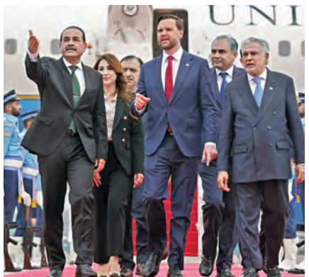
శనివారం ఇస్లామాబాద్ చేరుకున్న జెడివ్యాన్ బృందం ఇస్లామాబాద్, ఏప్రిల్ 11: ఇరాన్ పై యుద్ధం ముగింపు కోసం అమెరికా, ఇరాన్ దేశాల మధ్య జరుగుతున్న శాంతి చర్యల్లో పురోగతి కనిపించకపోయినా ఒకరి డిమాండ్ చార్జర్ మరొకరు పంపకున్నారు. >>2

ఇస్లామాబాద్ లో 'అమెరికా, ఇరాన్ మధ్య తొలిరోజు నాలుగు గంటలు చర్చలు పాక్ ప్రధాని షేహబాజ్ షరీఫ్ మధ్యవర్తిత్వం స్తంభించిన ఆస్తులు, నిధులు విడుదల చేయాలని ఇరాన్ డిమాండ్ కొత్త షరతులతో ముందుకు సాగని చర్చలు హార్డుకోపై కొనసాగుతున్న ప్రతిష్టంభన