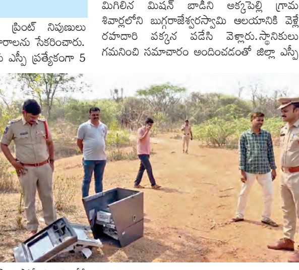
స్వామి మరియు ఫింగర్ ప్రింట్ నిపుణులు ఘటనా స్థలంలో కీలక ఆధారాలను సేకరించారు. నిందితులను పట్టుకునేందుకు ఎన్నో ప్రత్యేకంగా 5 బృందాలను రంగంలోకి దింపారు. దుండగులు వాహనం, మార్కుల వచ్చిన పచ్చని మోటార్ సైకిల్ గుర్తించేందుకు పోలీసులు పట్టుకోలేక ప్రధాన కార్యకర్తలకు ఉన్న సీఎస్ టీ పుటికేటను కృత్యంగా పరిశీలిస్తున్నారు. వక్కా ఫ్లాన్ లోనే ఈ దొంగతనం జరిగినట్లు ప్రాథమిక విచారణలో తెలిసింది. పోలీస్ స్టేషన్ కు కూత వేటు దూరంలోనే అంతటి సాహసోపేతమైన చోరీ జరగడంపై స్థానికులు భయాందోళన వ్యక్తం చేస్తున్నారు. అక్కపల్లి గ్రామ శివారులో ఏ టి ఎమ్ మిషన్ అమాతీ లభ్యం.... దర్శాపు మువ్వరం చేసిన పోలీసులు... ఎల్లారెడ్డిపేట మండల కేంద్రంలో శనివారం అర్ధరాత్రి జరిగిన ఏటీఎం చోరీ ఉదంతం కలకలం రేపింది. గుర్తుతెలియని దుండగులు ఎన్ టి ఐ ఏటీఎం

ఎల్లారెడ్డిపేట ఏప్రిల్ 11, ప్రభాతవార్త: ఎల్లారెడ్డిపేట మండల కేంద్రంలో దుండగులు బరితెగించారు. బిల్లర దొంగతనాలకు న్యస్త్ర పటికి ఏకంగా నగదుతో ఉన్న ఏటీఎం మెషిన్ పేకలింపకుని తీసుకెళ్లిన ఘటన జిల్లాలో కలకలం రేపింది. ఎల్లారెడ్డిపేట మండల కేంద్రంలోని పోలీస్ స్టేషన్ కు అతి సమీపంలో ఉన్న స్టేట్ బ్యాంక్ ఆఫ్ ఇండియా ఏటీఎంను లక్ష్యంగా చేసుకుని ఈ భారీ దోపిడీకి పాల్పడ్డారు. శుక్రవారం అర్ధరాత్రి సమయంలో గుర్తుతెలియని దుండగులు ఏటీఎం కేంద్రంలోకి చొరబడ్డారు. గ్యాస్ కట్టడంతో మెషిన్ కల కల చేసి ప్రభుత్వం చేయకుండా, ఏకంగా మెషిన్ ను పెకలింపి ముందుగా సిద్ధం చేసుకున్న వాహనంలో ఎక్కిమకుని వరదారయ్యారు. శనివారం ఉదయం ఏటీఎం వద్దరై తెరిచి ఉండటం, లోపల మెషిన్ లేకపోవడాన్ని గమనించిన పోలీసులు ఒక్కసారిగా పాకే గురయ్యారు. మెషిన్లో భారీ మొత్తంలోనే నగదు ఉన్నట్లు సమాచారం ఘటనపై సమాచారం అందిన వెంటనే జిల్లా ఎస్పీ మహేష్ బిత్ తి సలఘటనా స్థలానికి చేరుకుని స్వయంగా పరిశీలించారు. ఏటీఎం కేంద్రంలో భద్రతా లోపాలపై అధికారులను ఆరా తీశారు. క్లౌన్ టీమ్, డాగ్