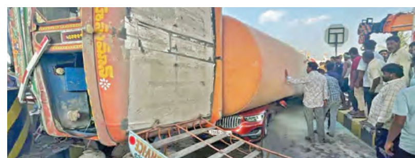
శనివారం కీసర దగ్గర కారుపై ట్యాంకర్ బోల్తాపడిన దృశ్యం

రాష్ట్రంలో 4 వేల మె.వా అణు విద్యుత్ కేంద్రాలు హైదరాబాద్, ఏప్రిల్ 11, ప్రభాతవార్త: తెలంగాణలో అణు విద్యుత్ ఉత్పత్తి దిశగా రాష్ట్ర ప్రభుత్వం యోచిస్తోంది. ఇందులో భాగంగా రాష్ట్రంలో 4 వేల మెగావాట్ల సామర్థ్యం కలిగిన అణు విద్యుత్ కేంద్రాలను ఏర్పాటు చేసేందుకు సుముఖత కనపరుస్తోంది. ఈ నేపథ్యంలోనే అణు విద్యుత్ కేంద్రాల ఏర్పాటు విషయంలో సాధ్య >>2