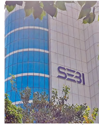
ప్రమాదాల వాతా 1.28 శాతానికి పడిపోయింది పబ్లిక్ షేర్ మార్కెట్లో కేటాయింపు 98.72 శాతానికి పెరిగింది. ఈ దర్యాప్తులో చోదంతరకు

న్యూఢిల్లీ, ఏప్రిల్ 11: అవకతవకలపై సెబీ దర్యాప్తు నిమిషం సంస్థల ట్రేడింగ్లో జరిగిన అవకతవకలకు సంబంధించి దర్యాప్తు నిర్వహించిన సెబీ 39 మంది వ్యక్తులు, సంస్థలను, కంపెనీలను, మార్కెట్లలో ట్రేడింగ్ చేయకుండా నిలిపివేసింది. అంతేకాకుండా అనుబంధ లబ్ధిని పొందారన్న ఆరోపణలు రుజువు కావడంతో రూ.2 కోట్లు జరిమానా కూడా విధించింది కంపెనీ పేరు ధరలు ఒక్కసారిగా అనూహ్యతీతో పెరగడమే ఈ అనుమానాలు, విచారణలకు తావిచ్చింది. 2024 ఏప్రిల్లో రూ.15 కన్న పేరు ధరలు 2025 అక్టోబరునాటికి రూ.10,887.10కి ఎలా పెరిగారన్న అంశంపై విచారణచేసింది. అంటే 725 రెట్లు కేవలం 19 నెలల్లోనే పెరగడంపై సెబీ దర్యాప్తు నిర్వహించింది. ఈ కారణాలనే కంపెనీ తన తొలి గ్రూపు జిడిఐఐఐఐ అండ్ పబ్లిసిటీని సువిధాన సమీకర్షణ ఫోకస్ సంస్థగా నిలిపింది. ప్రాధాన్యత కేటాయింపు కింద 1.35 కోట్ల షేర్లను రూ.12 చొప్పున కేటాయింపింది. ఆ తర్వాత