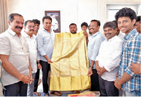
సరిసిల్ల మగ్గంపై 'బంగారు' అడ్డుతం

న్యూఢిల్లీ, ఏప్రిల్ 11: దేశ రాజధాని ఢిల్లీలో వాయు కాలుష్యంపై పోరులో భాగంగా బిజెపి ప్రభుత్వం సంవత్సరం తీసుకోవడానికి నిర్ణయించింది. నగరంలో పెట్రోల్ ట్యాంకర్ల వినియోగాన్ని దశలవారీగా తగ్గించే లక్ష్యంతో కొత్త ఎలక్ట్రిక్ వాహనాలు (ఈవీ) పాలిసీ ముసాయిదాను శనివారం విడుదల చేసింది. ఈ ముసాయిదా ప్రకారం 2028 ఏప్రిల్ 1 నుంచి దేశ రాజధానిలో కొత్త పెట్రోల్ ట్యాంకర్ల (బైకులు, న్యూట్రు) రిజిస్ట్రేషన్లు పూర్తిగా నిలిపివేయనున్నారు. ముందుగా, 2027 జనవరి 1 నుంచే కొత్త పెట్రోల్ లేదా సీఎన్జీ ఆల్ రిజ్లా రిజిస్ట్రేషన్లు నిషేధించి విధించనున్నారు. 2030 నాటికి ఢిల్లీని పూర్తిస్థాయి ఈవీ నగరంగా మార్చడమే లక్ష్యంగా ఈ ప్రణాళికను రూపొందించారు. ప్రజలను ఎలక్ట్రిక్ వాహనాల వైపు ప్రోత్సహించేందుకు ప్రభుత్వం భారీ రాయితీలను ప్రకటించింది. మొదటి ఏడాదిలో ఈవీ ట్యాంకర్ల కొనుగోలు చేసేవారికి రూ.30,000 వరకు సబ్సిడీ, రోడ్డు ట్యాక్స్, రిజిస్ట్రేషన్ ఫీజులు నుంచి పూర్తి మినహాయించి ఇస్తున్నట్లు. అలాగే, పాత పెట్రోల్ వాహనాన్ని తుక్కుగా మార్చి కొత్త ఈవీ కొనే అవకాశం రూ.10,000 ప్రోత్సాహకం అందిస్తారు. ప్రతి ఈవీ డీలర్ వద్దే పబ్లిక్ ఛార్జింగ్ స్టేషన్ తప్పనిసరి చేయవలసిగా పాటు, ఇళ్ల వద్ద ఛార్జింగ్ పాయింట్ల కొనసాగించే విధానం తీసుకురానున్నారు. ప్రస్తుతం ఇది ముసాయిదా దశలోనే ఉంది. ఈ పాలిసీపై ప్రజలను అభిప్రాయాలను 2026 మే 1 వరకు స్వీకరించి, ఆ తర్వాత ప్రభుత్వం తుది నోటిఫికేషన్ జారీ చేయనుంది. ఢిల్లీలో శీతాకాలంలో పెరిగే వాయు కాలుష్యానికి వాహనాల నుంచి వెలువడే ఉద్దారాలు 23 శాతం కారణమవుతున్నాయని అంచనా. ఈ నేపథ్యంలోనే ప్రభుత్వం కఠిన చర్యలకు ఉపక్రమించింది.